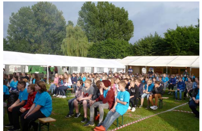
Konfirmanden beim Konfi-Camp

einem bezirksübergreifenden Ansatz oder einem zweijährigen Turnus des kirchlichen Unterrichts.