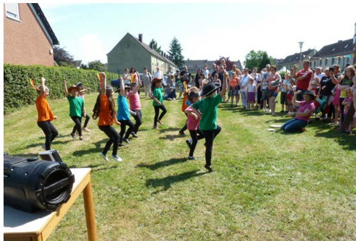
Aufführung des Johanneskindergartens Hamm-Norden

Die Trägerschaft unserer Kindertagesstätten liegt beim Evangelischen Kirchenkreis Hamm. Dadurch ist das Presbyterium von der Bearbeitung der laufenden Geschäftsbetriebe entlastet. Die Kindertagesstätten sind wichtige Orte und ein wichtiger Arbeitsbereich der Kirchengemeinde geblieben. Hier kommen Kinder und ihre Familien mit der guten Botschaft und mit unserer Kirchengemeinde in Kontakt. Atmosphäre, Identität und Respekt sind die Merkmale, die für alle Einrichtungen verpflichtend sind.