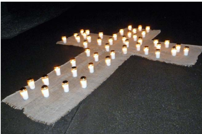
Abendsegens Ewigkeitssonntag auf dem Friedhof Johanneskirche

„Leuchttürme“ sind für uns Projekte, die stellvertretend oder gemeinsam getragen werden und ausstrahlen in die Gemeinde und darüber hinaus. Dazu gehören die Stadtkirchenarbeit, die Musikschule der Kirchengemeinde und die Sommerkirche. Daneben versammeln wir uns an