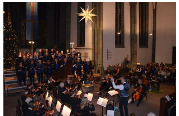
Konzert in der Pauluskirche

Die kirchenmusikalische Vielfalt ist eine Bereicherung für die Gemeinde. In Zukunft soll der Blick über eigene Bezirksgrenzen hinaus gerichtet werden. Aus den Lagerfeuern der Bezirke sollen gemeinsame Leuchttürme werden. Dies geschieht in Form von gemeinsamen Projekten, Konzerten und die bezirksgrenzenübergreifende Nutzung der unterschiedlichen Spielstätten. Dazu setzen wir uns das Ziel, die Angebote noch besser miteinander zu verzahnen.