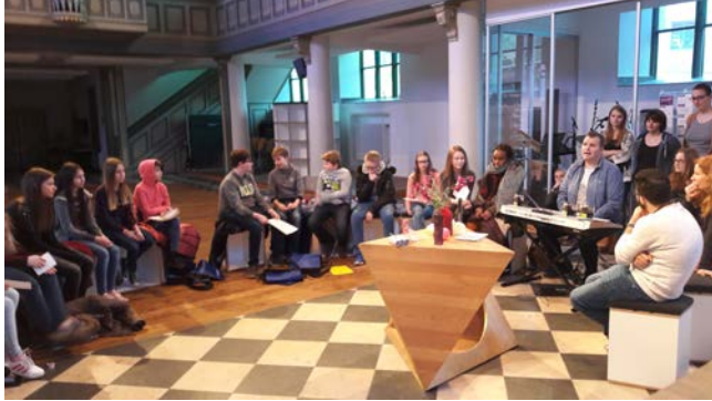
Konfirmanden in der Jugendkirche / Lutherkirche

Der Konfirmandenunterricht ist von seinem Ursprung her nachgeholter Taufunterricht. Noch immer erreichen wir mit der Konfirmandenarbeit einen großen Teil aller Jugendlichen eines Jahrgangs. Von daher ist die Konfirmandenzeit eine große Chance, junge Menschen an das Leben der