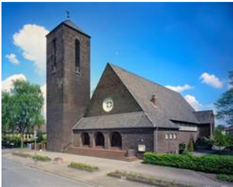
Johanneskirche, ©Heinz Feußner

Im Gebiet nördlich der Lippe wurde 1937/38 die Johanneskirche als eine der wenigen Kirchen in der Zeit des Nationalsozialismus errichtet. Sie hat bis heute eine wichtige kulturhistorische Bedeutung.