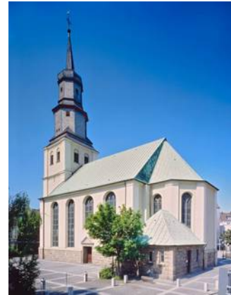
Lutherkirche, ©Heinz Feußner

Zentrale Kirche der Kirchengemeinde Hamm ist die Pauluskirche in der Stadtmitte. Sie bildet nicht nur einen räumlichen Mittelpunkt, sondern hat mit der „Stadtkirchenarbeit“ eine bezirks- und kirchengemeindeübergreifende Funktion.