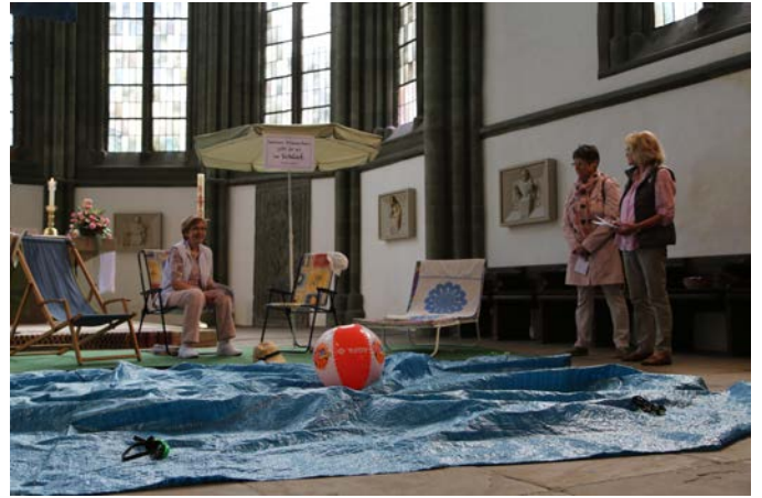
Sommerkirche in der Pauluskirche

Zukünftig wollen wir an zielgruppenorientierten Gottesdiensten und Gottesdienstzeiten weiterarbeiten. Gottesdienst, Gemeindeaufbau und Seelsorge sollen zusammen gedacht und in der Kirchengemeinde Hamm gelebt werden.