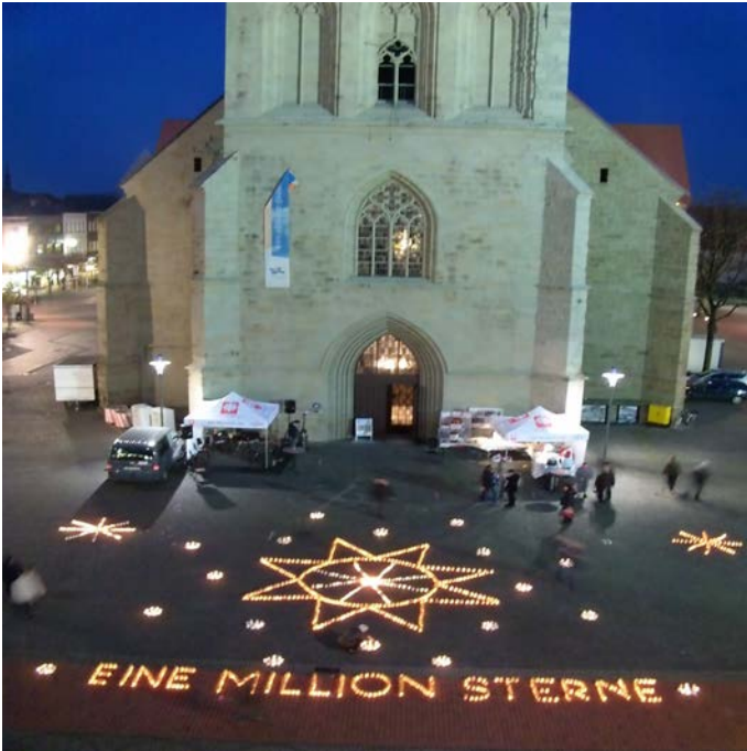
Aktion der Stadtkirchenarbeit: "Eine Million Sterne"

Die Pauluskirche mit ihrer zentralen Innenstadtlage ist eng eingebunden in den Rhythmus der Stadt. Sie ist ein Ort der Begegnung mit Gott und des gelebten Glaubens. Für Konzerte und