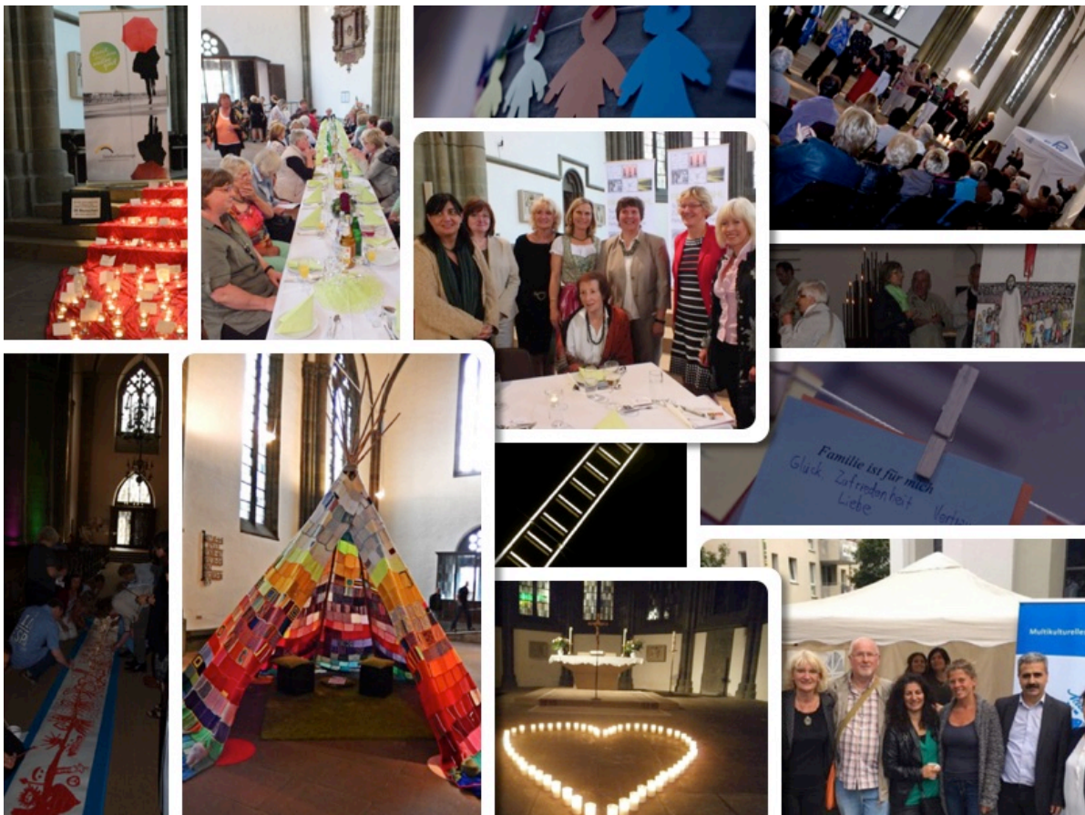
Impressionen von den Projekten der Stadtkirchenarbeit